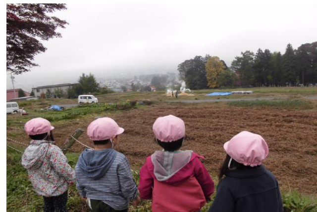
もも組さんの視線の先では農協青年部の方達がさつまいもをやいてくれています。「ありがとうーありがとうー」と大きな声で叫んでいる子ども達です。