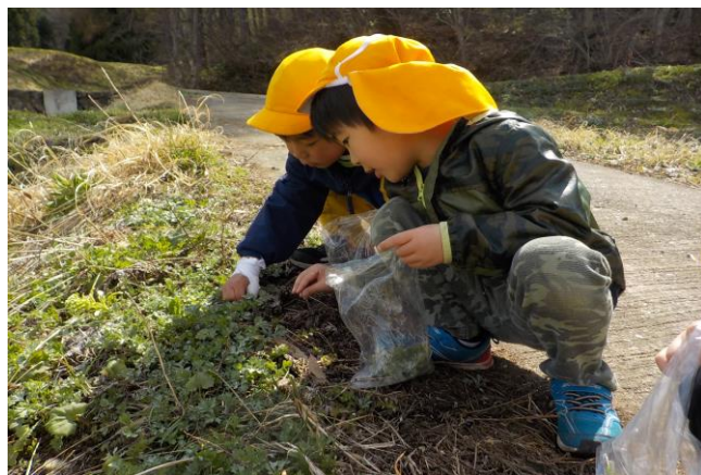
みどり組の子どもたちがよもぎ取りにでかけました。一生懸命につんでいました。