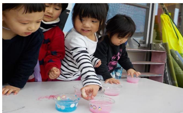
「カップに入った色水が凍ってる!」と、興味深々のきいろ組さんたちです。

新しい年が明けて、あっという間に1ヵ月が過ぎようとしています。楽しみにしていた15日の保育参観は中止になってしまい、とても残念でした。ひよこ組さんの玄関から見える雪山は、外に出るとひよこさんが遭難しそうな高さになり、雪山に向かう戦闘意欲がなかなか湧いて来ません。少人数で行ったミニミニコンサートには、ひよこさんも初めてのステージに立つことができました。最初はステージの通行人だけの予定でしたが、ステージで遊んでいるとお友達を待つ、じっとしていることができ、「えっ?これはもしかして…」と鈴を持たせてみると喜んで振っている姿がありました。保育士が思っている以上に子どもたちは成長していたんだな…と感じた場面でした。当日はぐちゃぐちゃになっていましたが、それでもみんなから拍手をもらって満足な1日になりました。そして新入園児さんも2名増え、新しい風を吹かせてくれています。再び泣き声が聞こえるようになり、今までいたお友達も赤ちゃん返りのように不安になったり、そうかと思えばお兄ちゃんお姉ちゃんぶりを発揮して「いい子いい子」と頭をなでてくれたり、抱っこしてほしいのに我慢するような姿を見せてくれたりします。3月には再び2名の新入園児さんを予定しています。なかなか落ち着くことのないひよこ組さんですが、成長がはっきり見えるのもひよこ組さんの楽しみです。イヤイヤ期真っ只中のこの時期を丁寧に大切に见守って行きたいと思っています。