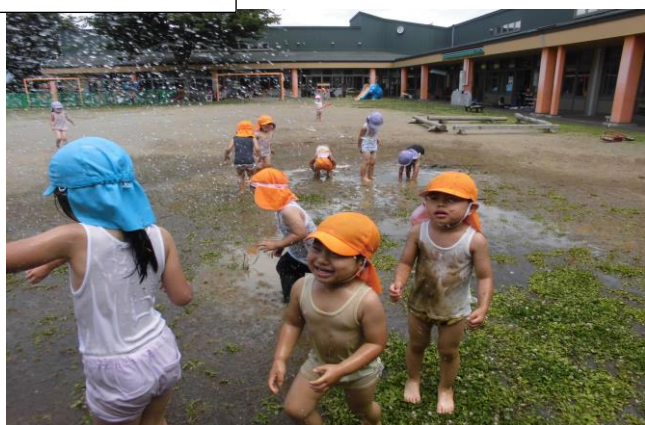
きいろ組のおともだちがニコニコ笑顔で、泥遊びを楽しみました。