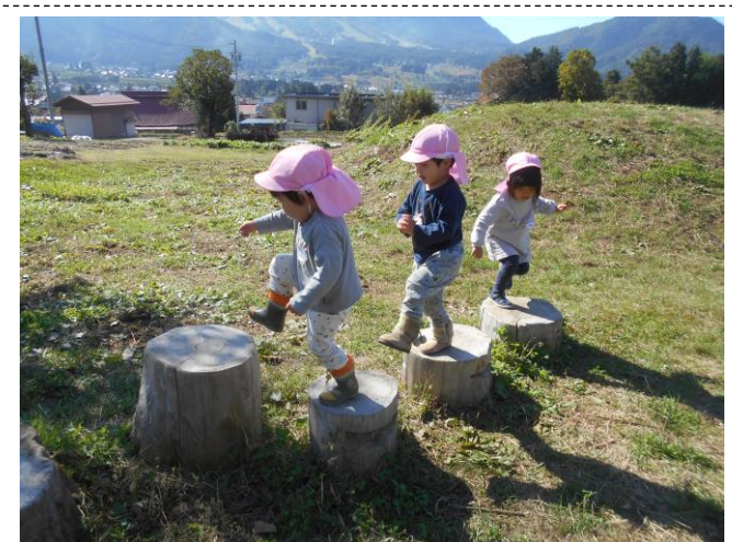
もも組の子ども達がピョンピョンランドで遊んでいます。上手に渡れるかな？ ～ピョンピョンランド～ 昨年度、農林高校生が園舎裏手の昆虫ランドに、写真のような木製遊具を設置してくれました。 命名も農林高校生です♪