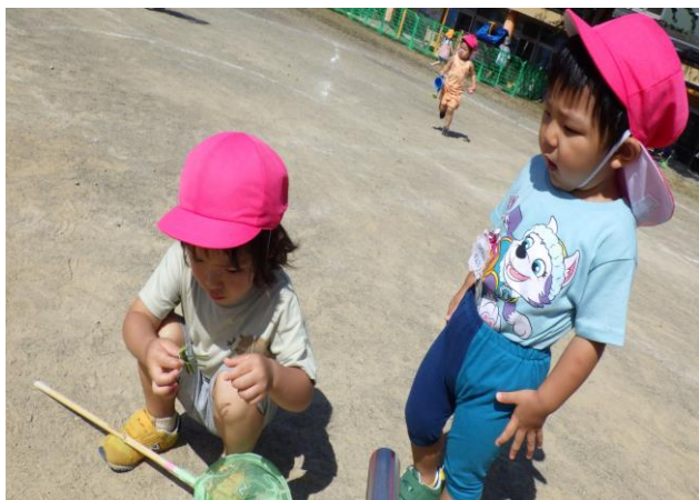
昆虫が大好きなもも組のお友だち。 大きなバッタをつかまえました。 怖がらず、よーく観察しています。