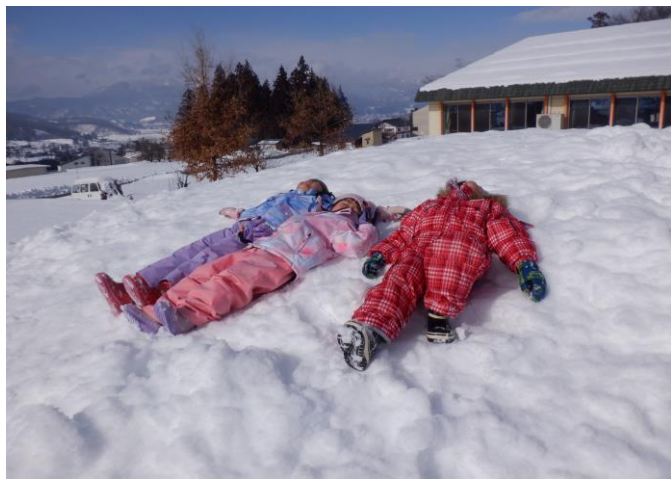
みどり組の子ども達が寝転がり空を見えています。どんな話をしているのかな？