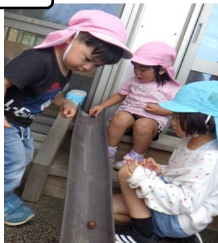
ケヤキの森で拾ってきたドングリ。あか組さんと一緒に転がして楽しみました