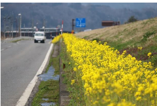
例年より早く菜の花が咲き始めました